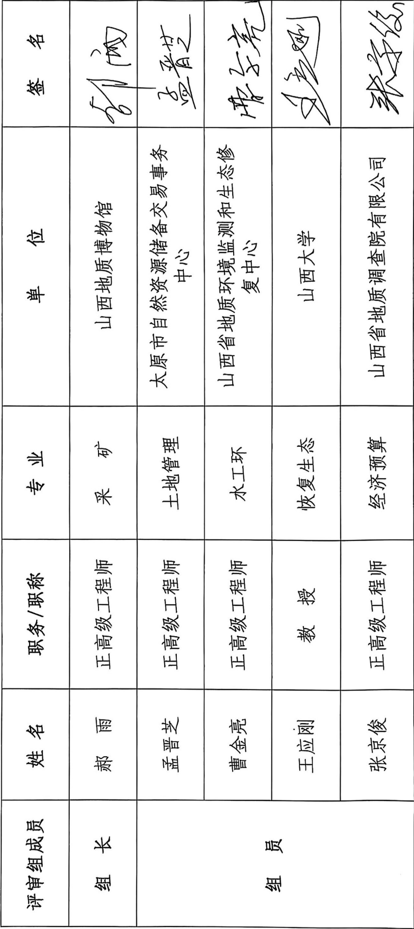
《山西省孝义市山西东义集团特种水泥有限公司锦玉石材厂建筑石料用石灰岩矿产资源开发利用和矿山环境保护与土地复垦方案》评审专家组成员名单